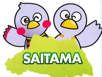
さいたまっち コバトン