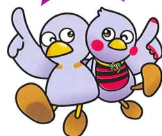
コバトン さいたまっち